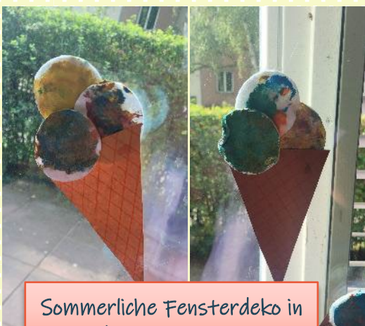
Sommerliche Fensterdeko in der roten Basis