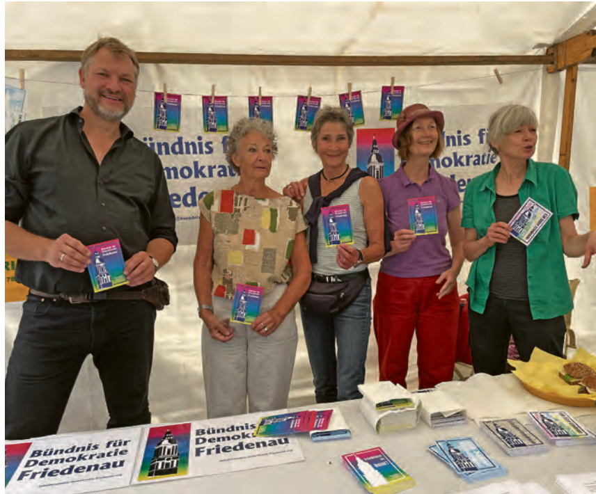
Sichtbar bei Stadtteilfesten: das Bündnis für Demokratie