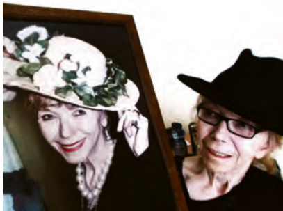
„Rose of Fame“ nennt man sie

Sie konnte allen Unkenrufen trotzen und doch noch das 15-jährige Jubiläum ihres Geschäfts feiern. Leider musste sie dieses jetzt, aus gesundheitlichen Gründen und damit unvorhersehbar, aufgeben. Es musste alles geräumt werden. Aber das war nicht so einfach,