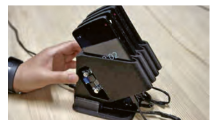
Handys in Reihe geschaltet

Genau das haben sich Wissenschaftler an den Hochschulen von Tartu (Estland) und Dortmund gedacht und aus alten Smartphones eine kleine Datenverarbeitungseinheit gebastelt. Wie sie zeigen konnten, ist das nicht nur nachhaltig, sondern obendrein kostengünstig: den Prototyp aus vier alten Handys zu bauen kostete nur 8 Euro. Dazu wurden als erstes die Akkus ausgebaut und durch externe Energiequellen ersetzt, damit keine Schadstoffe austreten können. Dann wurden die Handys miteinander verbunden und in einen reprogrammierbaren Zustand versetzt. Verpackt in ein 3D-gedrucktes, wasserdichtes Futteral war der prototypische Miniprozessor fertig für den Einsatz. Unter Wasser zählte er verschiedene Meerestiere. Solche Ermittlungen erfordern normalerweise, dass ein Taucher unter Wasser Videoaufnahmen macht, die später ausgewertet werden müssen. Mit dem recycelten Miniprozessor ging es automatisch. Solche recycelten Prozessoren lassen sich vielerorts für die Datenerfassung und -analyse einsetzen. Die Entwickler meinen: Die Technik von gestern kann die Lösung von morgen sein. Wunderbar! Hoffentlich wird das Verfahren möglichst bald und in großem Stil umgesetzt. (DOI 10.1109/MPRV.2025.3541558)