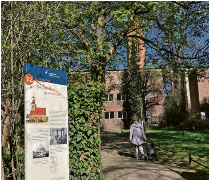
Hier stand einmal die Dorfkirche, erklärt die Schautafel