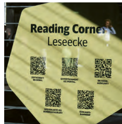
„Lesen“ à la Deutsche Bahn

Ich merke, wie sich meine Laune bessert. Hier kann ich nach Belieben schmökern, einfach so, ohne Phone. Ich kann Studien über die Buchauswahl