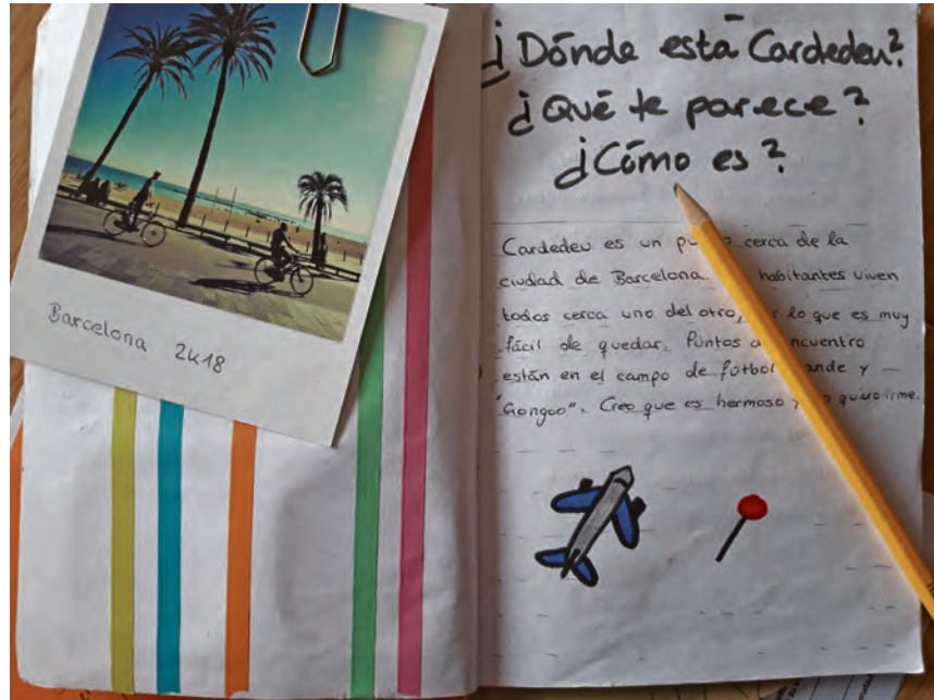
Ihr Reisetagebuch führen die Berliner Schüler auf Spanisch