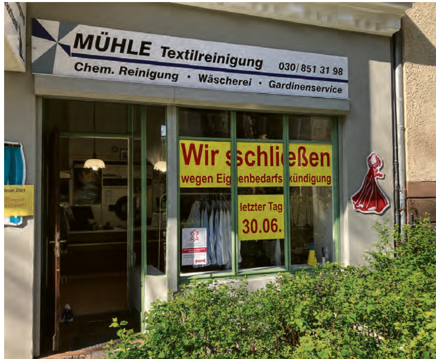
Schluss nach Jahrzehnten. Die Inhaberin des Ladens in der Isoldesstraße wird keine neue Adresse suchen. Es ist aussichtslos, Räume für eine Reinigung zu finden.