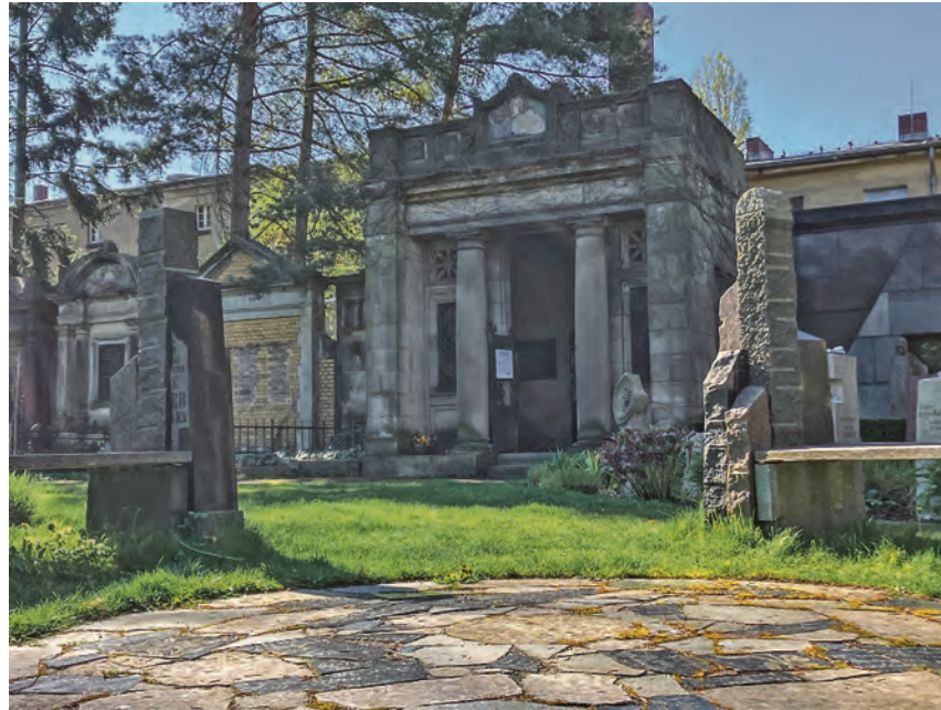
Zur Kleinen Ewigkeit: Sitzbänke laden zur Pause ein, dahinter das Mausoleum

sämtliche Geschäfte, die vielen Imbisse und Backshops, Cafés usw., die im Bahnhof zu finden sind. Es gibt keine Überraschung: alles Ketten mit nahezu identischem Angebot. Das ist kein Bahnhof mehr, das ist eine Shopping Mall mit Bahnanschluss!