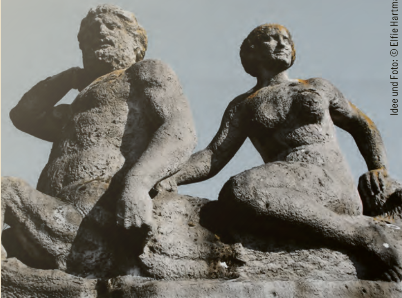
Idee und Foto: © Elfie Hartmann

...eines von insgesamt vier Figurenpaaren auf der Brüstung Carl-Zuckmayer-Brücke über dem U-Bahnhof Schöneberg. Dieses Paar ist platziert mit Sicht nach Westen über den Entenich und zum anschließendem Wiesenal. Sie wurden erschaffen von dem Bildhauer Richard Guhr.