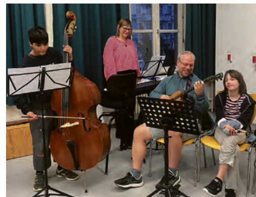
Inklusionsband: Alle probieren viele Instrumente aus

✓ Alle weiteren Infos: meike.goosmann@lkms.de