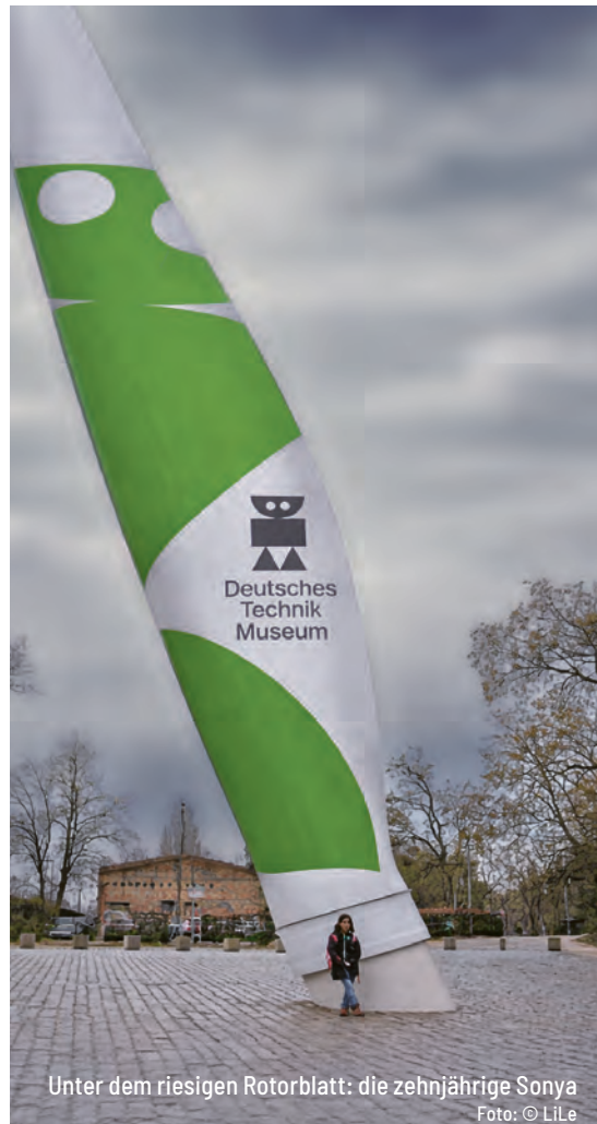
Unter dem riesigen Rotorblatt: die zehnjährige Sonya

Mensch angesichts der Technik ist, zeigt das Foto mit Sonya vor dem Rotorflügel eines Windrades am Technikmuseum (Höhe insgesamt 44 m). Der Eintritt ist, hier wie auch anderswo, oft ermäßigt (z.B. mit Berliner Familienpass) oder sogar frei.