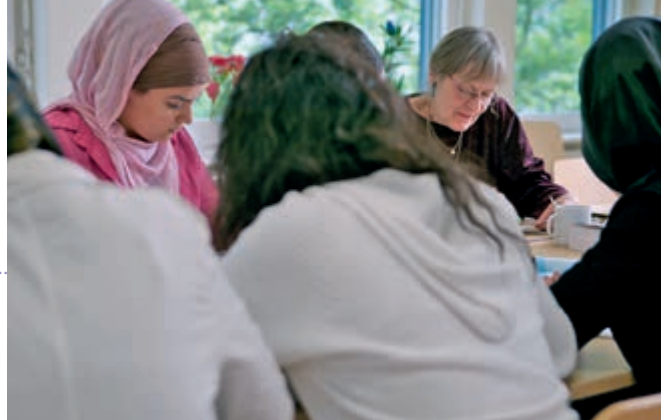
Konzentriertes Arbeiten, jeden Nachmittag

„So entstehen nicht selten Freundschaften zwischen einzelnen Mädchen und den Ehrenamtlichen. Diese berichten uns dann manchmal über ehemalige Schülerinnen, weil sie noch Kontakt haben. Die Mädchen melden sich bei ihnen. Und