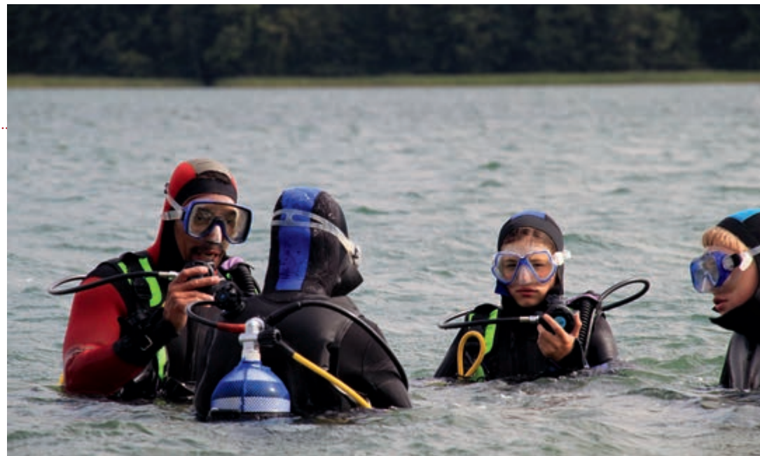
... und anschließend hinein zum Tauchen

(Musik: „We are going on a summer holiday ...“)