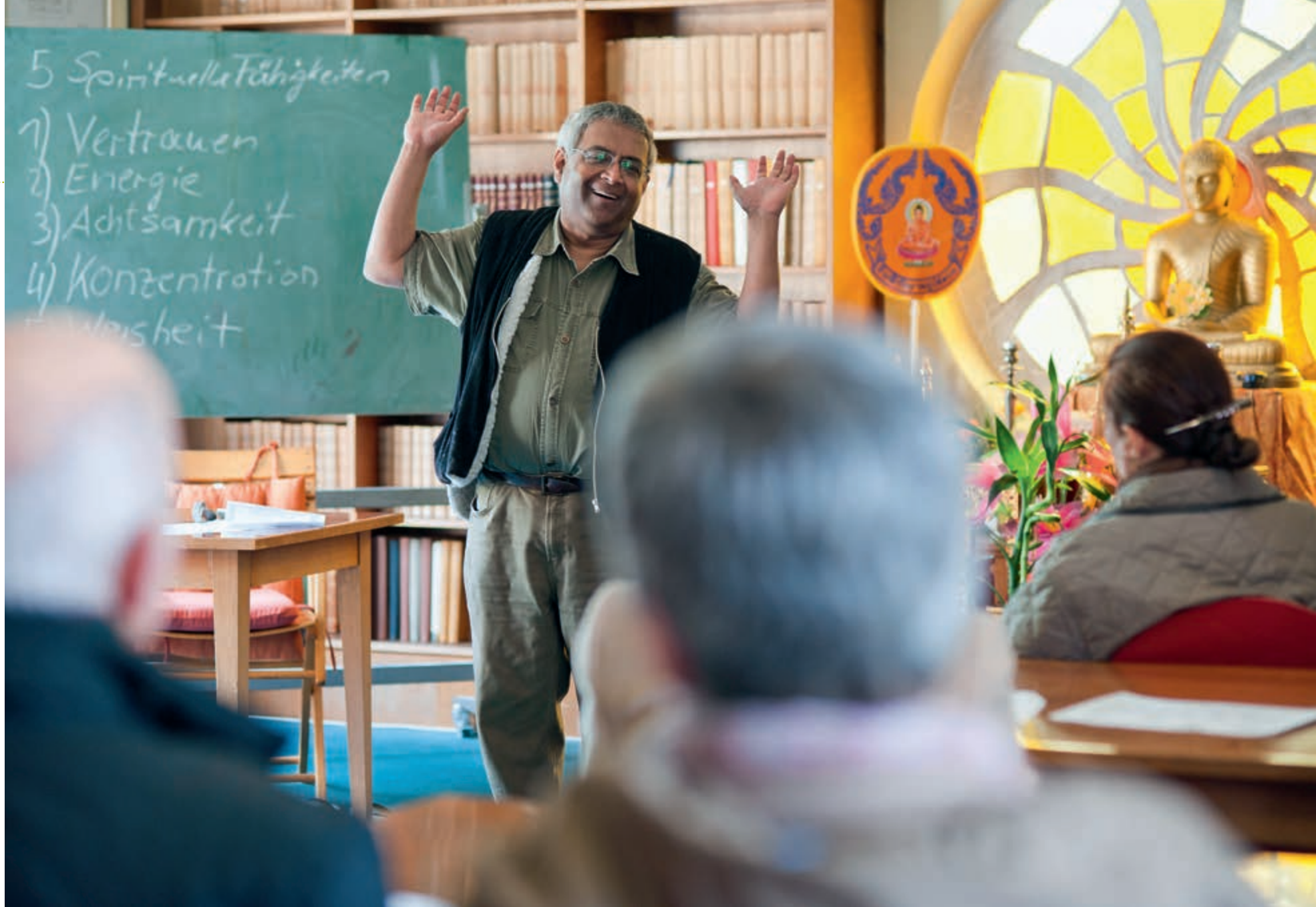
Dynamischer Empfang im Buddhistischen Haus Frohau