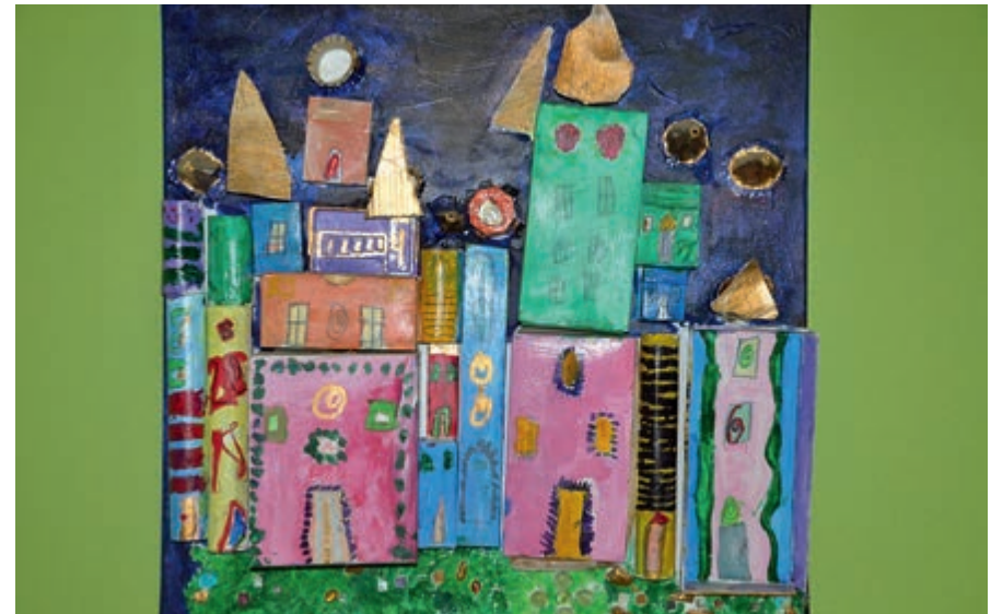
Lachende Häuser, frei nach James Rizzi (o.) und Hundertwasser