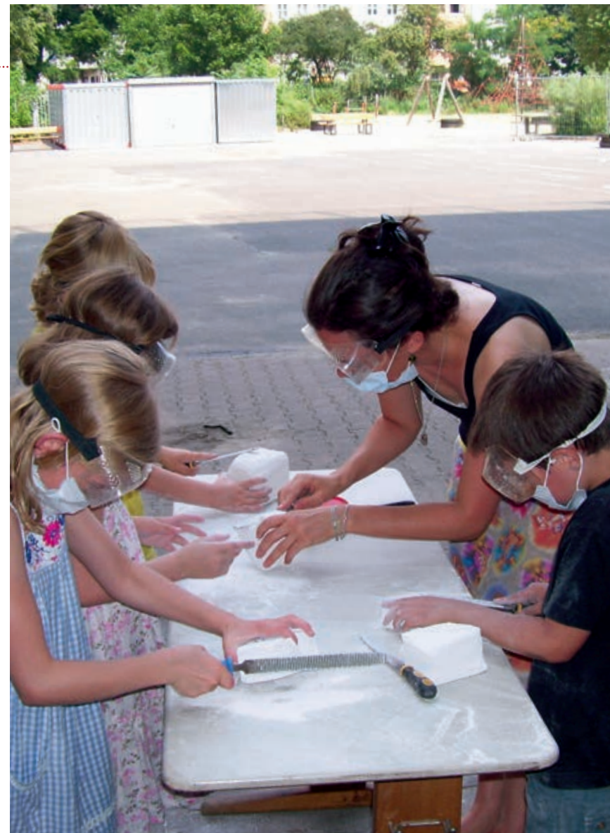
Ausgefeilt: So entstehen „Schmucksteine“ für eine Ausstellung in der Schule

Unsere Schule bringt das weit voran: In solch einem Prozess macht man sich immer mehr Gedanken, was noch sinnvoll ist. In jedem Herbst, wenn die kommenden Erstklässler bei uns angemeldet werden müssen, richten wir zum Beispiel ein Elterncafé ein. Mütter und Väter kommen dort mit uns ins Gespräch, sie dürfen in die Klassen gehen. Mittlerweile steigt das Interesse an unserer Schule, gerade in Elternkreisen, von denen wir wissen, dass sie vorher skeptisch waren.“