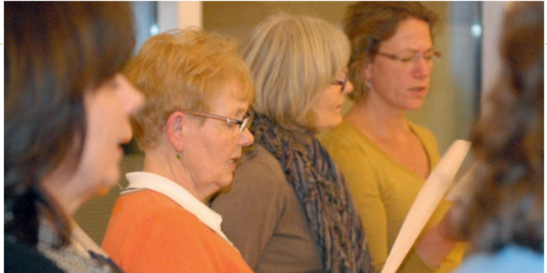
Am Nachbarn orientieren hilft immer: Teilnehmerinnen beim Offenen Singen