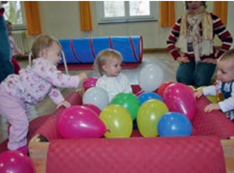
Töne, Klänge, bunte Bälle: im Kleinkindkurs