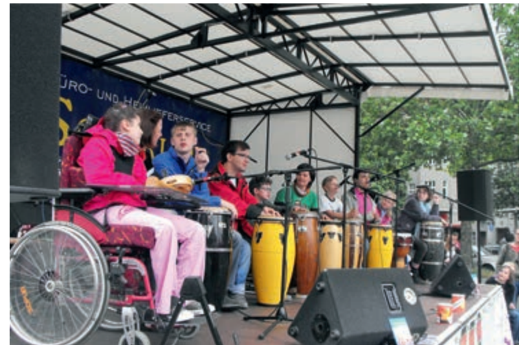
Bühne frei: Die Kifrie-Band „Tumble Weeds“ (o.) und die Trommelgruppe „Maraschicki“