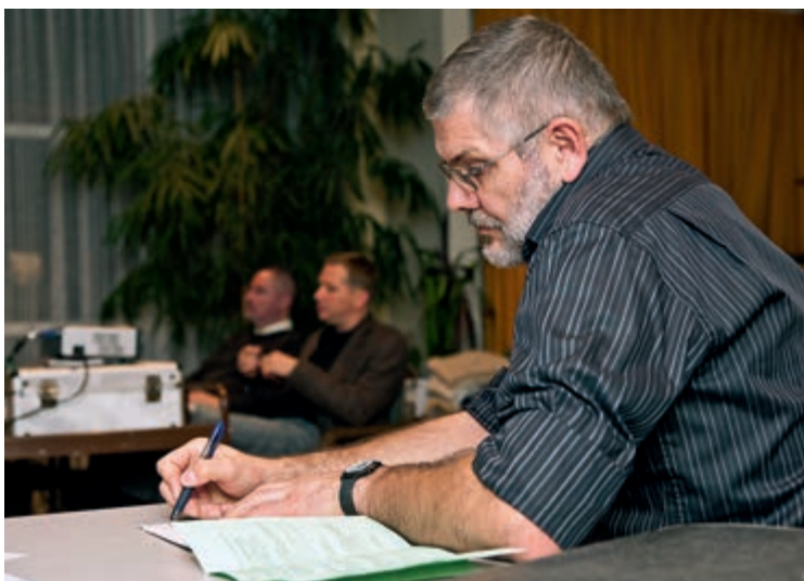
Hilfe für ehrenamtliche Betreuer/innen: Cura bietet viele solcher Veranstaltungen an