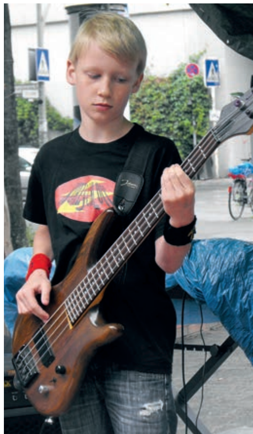
Im Takt. Kinder lernen Musik in Workshops, viele gründen eigene Gruppen. Rechts der Bassist von „Kurzschluss“