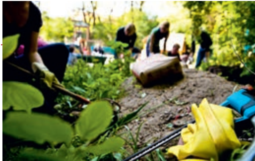
Zu Beginn: freie Flächen, Arbeitsgeräte (u.)