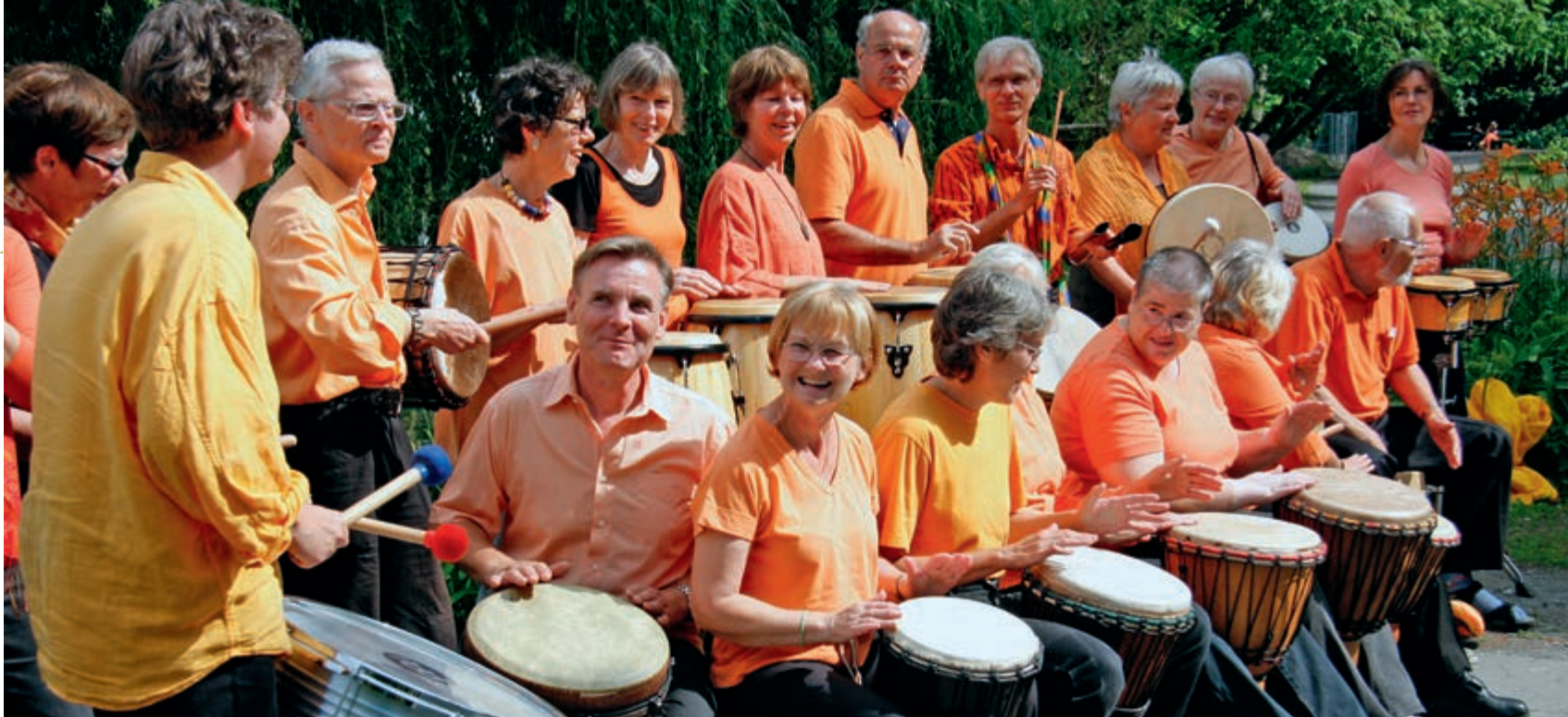
Der „DrumCircle Lietzensee“ bei der Arbeit