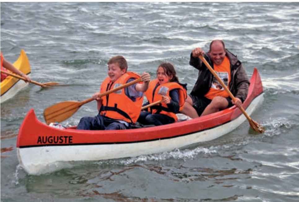
Mit Auguste über den See ...

and a GPS, the other group followed. How was it when you found the treasure? We wrote our names into the logbook. (...)