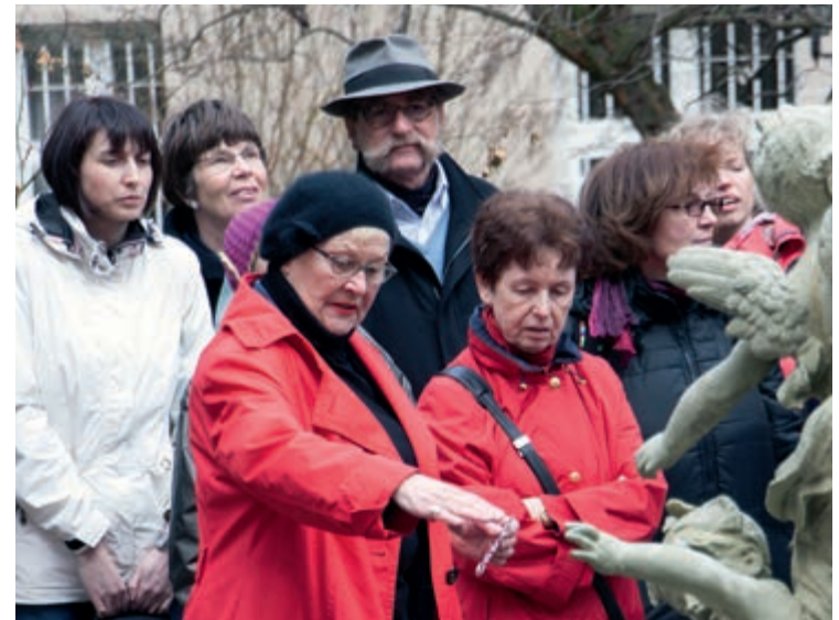
Bei einer Goldschmiedin (o.), Friedenauspaziergang