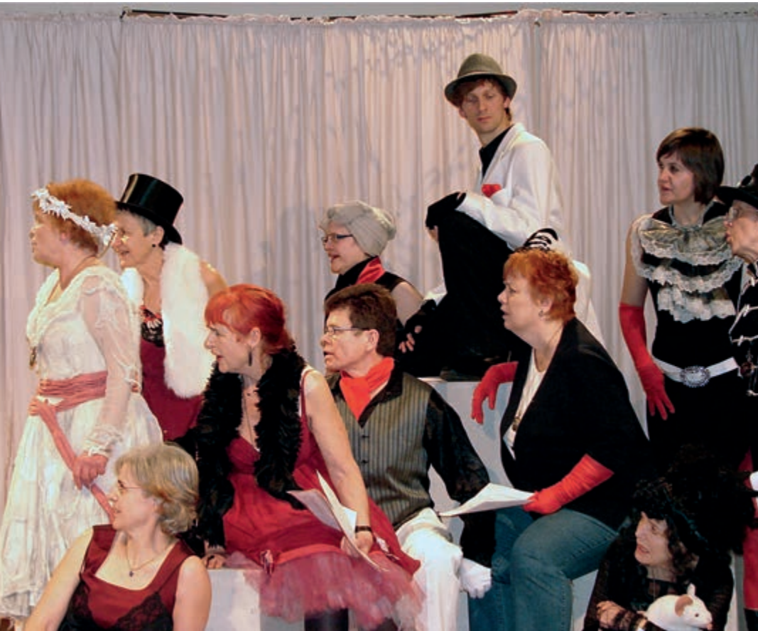
Schauspieler der „Spätzünder“ und aus dem Hospiz im Theaterstück