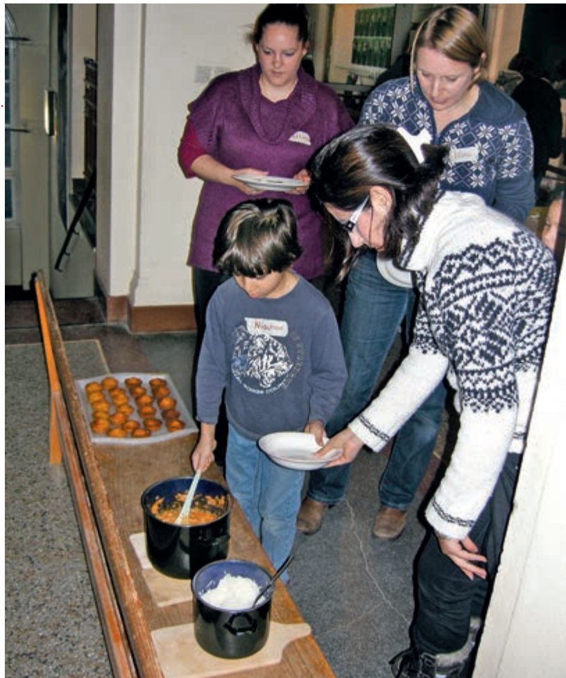
Jung und Alt macht Schule. Sie spielen und essen zusammen, entweder im Garten oder auf dem Schulflur. Da gibt es selbstverständlich auch Selbstgekohtes.